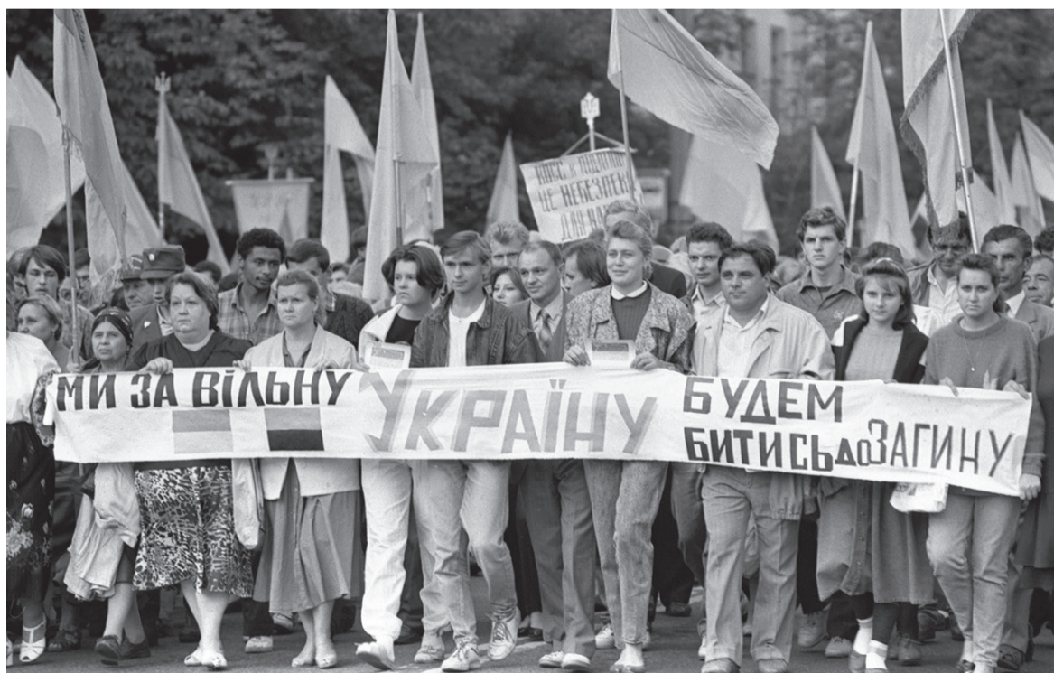
Віче на підтримку Акту проголошення незалежності в 1991 році (архівне фото)