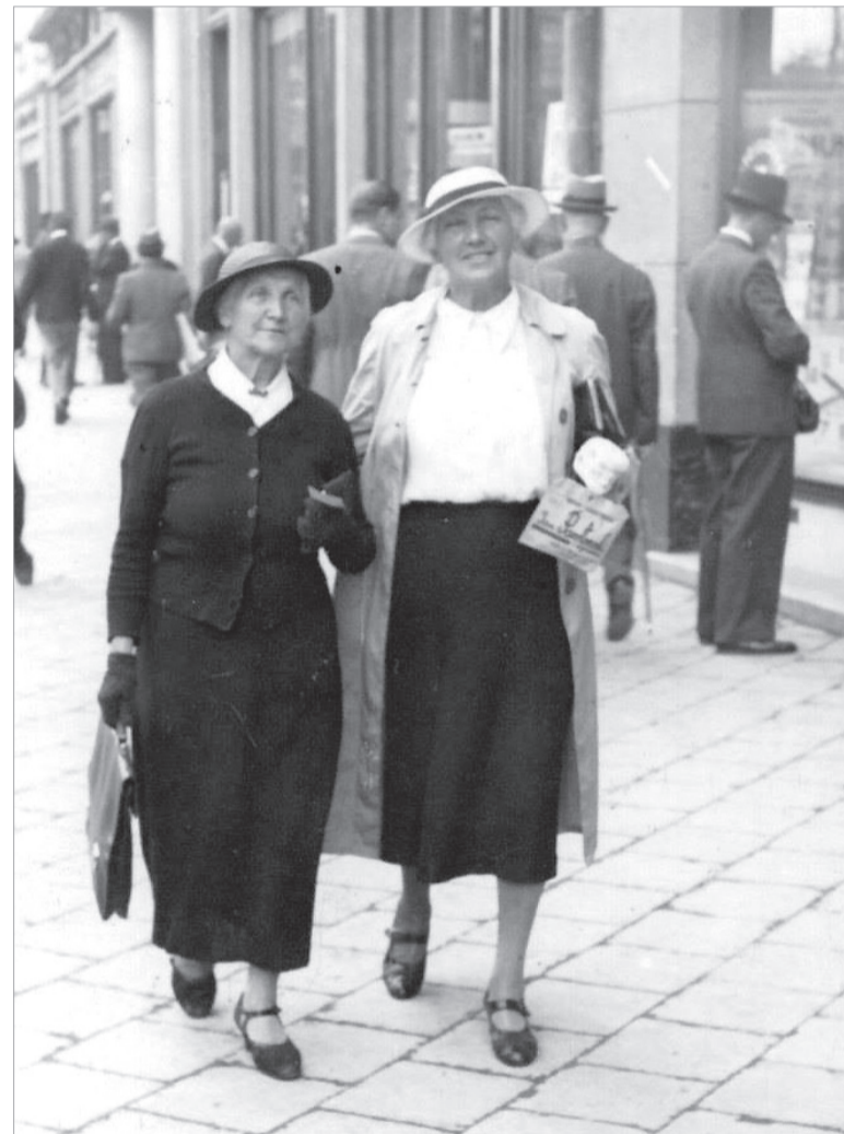
Соломія Крушельницька у літньому віці (ліворуч)