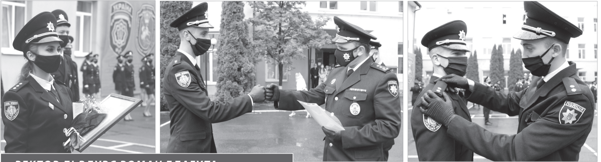
РЕКТОР ЛЬВДУВС РОМАН БЛАГУТА: